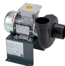
11433 - Modell 3 Radial 380 V, mit Ex-Motor *** mit Schlauch 750 mm ***