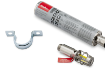
11561 - Aerosol- Löscher für Akku- Schrank WX20TH + BTA-CT-79 + Magnet