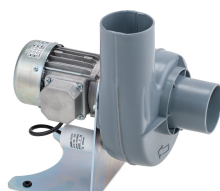
11431 - Modell 1 Radial 230 V, ohne Ex-Motor *** mit Schlauch 750 mm ***