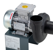
11433 - Modell 3 Radial 380 V, mit Ex-Motor *** mit Schlauch 750 mm ***