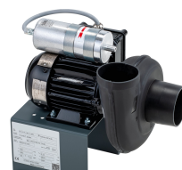
11432 - Modell 2 Radial 230 V, mit Ex-Motor *** mit Schlauch 750 mm ***