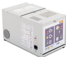
10963 - Umluftventilator SST UL mit Adapter SST-P F90 für Sicherheitsschrank