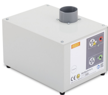
8739 - Abluftventilator SST AL mit Adapter SST-P F90 für Sicherheitsschrank