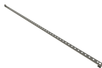
12074 - Zubehörpaket aktive Lagerung f. Sicherheitsschrank PROline 6 u. 12/20