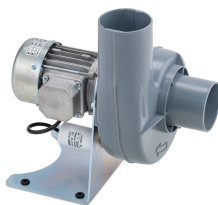
11431 - Modell 1 Radial 230 V, ohne Ex-Motor *** mit Schlauch 750 mm ***