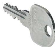
12077 - Ersatzschlüssel PROline für PROline mit Schließkern 0001