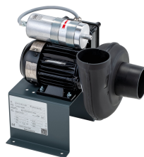
11432 - Modell 2 Radial 230 V, mit Ex-Motor *** mit Schlauch 750 mm ***