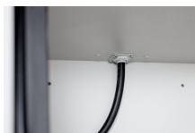
11884 - Kabeldurchführung 6 u. 12/20 kpl. verp. f. Sicherheitsschrank PROline 6 u. 12/20