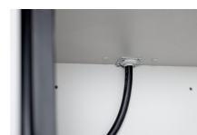
11884 - Kabeldurchführung 6 u. 12/20 kpl. verp. f. Sicherheitsschrank PROline 6 u. 12/20