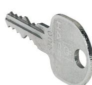
12077 - Ersatzschlüssel PROline für PROline mit Schließkern 0001