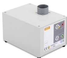
8739 - Abluftventilator SST AL mit Adapter SST-P F90 für Sicherheitsschrank