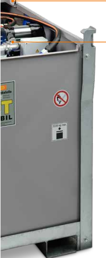
DT-Mobil PRO ST COMBI 980/200 Premium Plus, mit Pumpe Bipump

Für die Versorgung von Generatoren und Zeltheizungen.